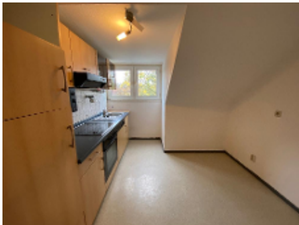
Küche mit Einbauküche