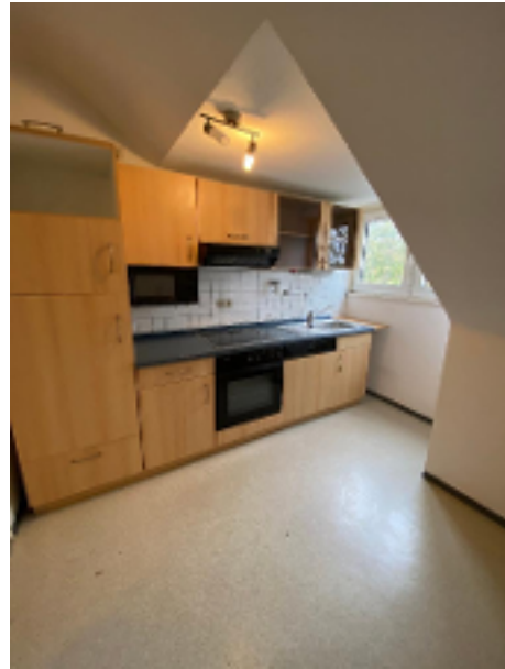
Küche mit Einbauküche