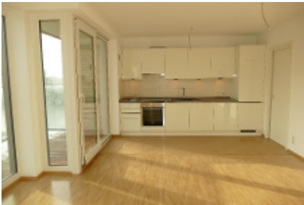
Wohnraum mit Einbauküche